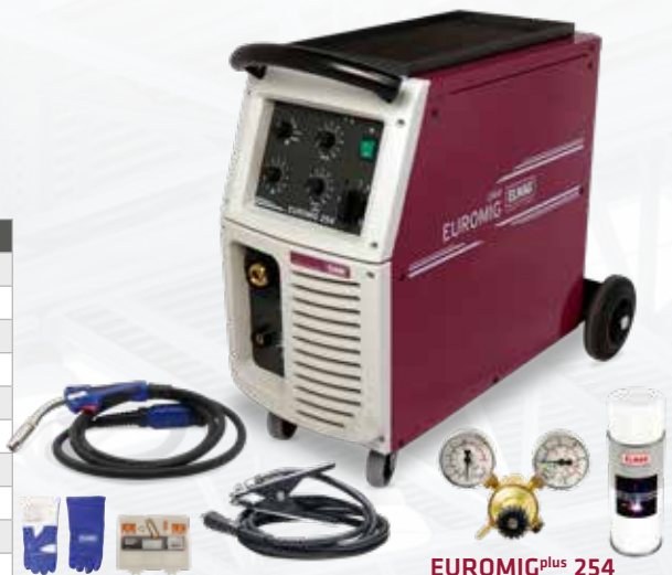
EUROMIG plus 254

GRATIS! Verschleißteile-Set und ein Paar Schweißer-Handschuhe