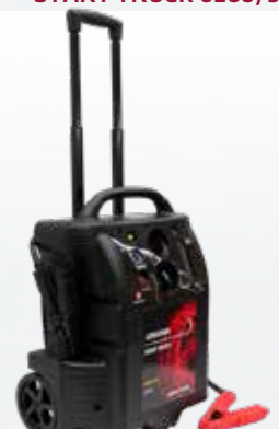
START TRUCK 6400/3200