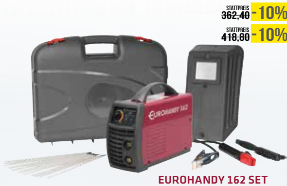
EUROHANDY 162 SET

STATTPREIS 362,40 -10% 326,- STATTPREIS 418,80 -10% 377,-