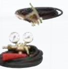
WIN TIG DC 180 M P&P-SET