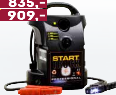
START TRUCK 5000/2500