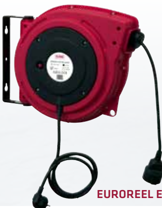
EUROREEL ELECTRIC 20/230