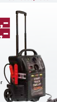
START TRUCK 6200/3100