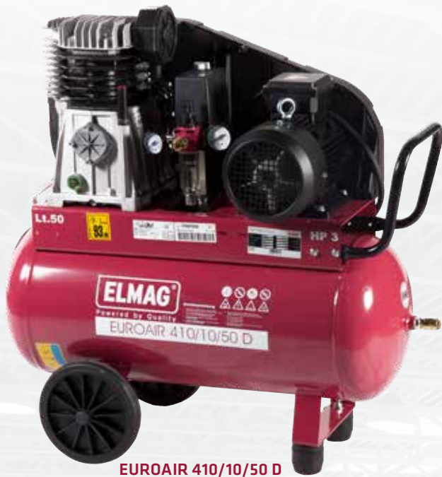
EUROAIR 410/10/50 D