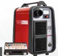
PLASMA SOUND PC 110/T