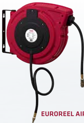
EUROREEL AIR 8/10