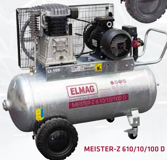
MEISTER-Z 610/10/100 D