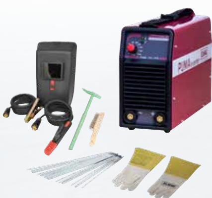
PUMA 1701 PFC ECO-SET

STATTPREIS 847,20 -10% 759,- STATTPREIS 922,80 -10% 829,-