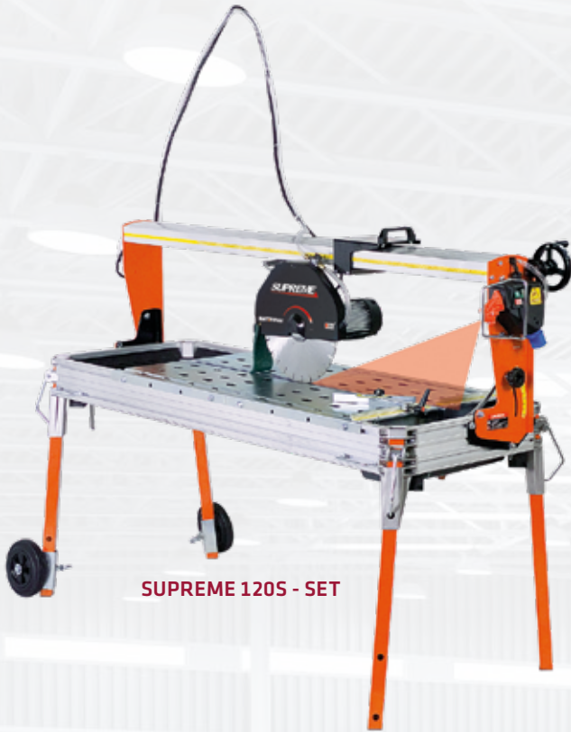
SUPREME 120S - SET