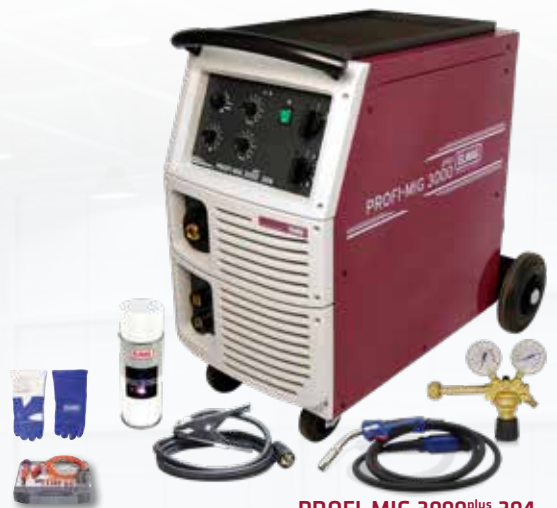
PROFI-MIG 3000 plus 304

GRATIS! Verschleißteile-Set und ein Paar Schweißer-Handschuhe