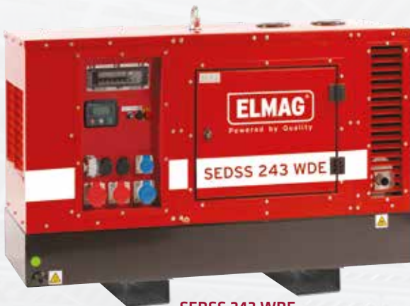
SEDSS 243 WDE