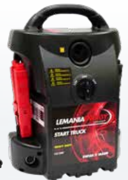
START TRUCK 6200/3100