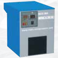
Best. Nr. 00900