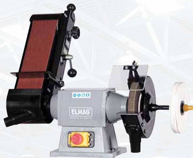
KSM 1000/200 N