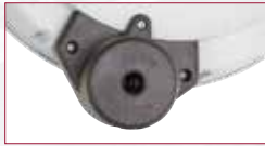
Rücklaufbremse „SLOW MOTION“

STATTPREIS INKL. MWST. 318,60 REGATT -26% 236,-