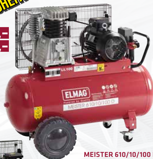
MEISTER 610/10/100 D